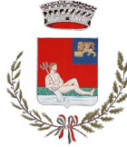
COMUNE DI POLESSELLA